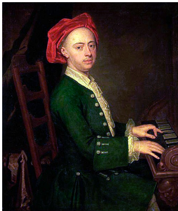
De jonge Händel door James Thornhill, ca.1720

Pasen komt snel dichterbij! Op Goede Vrijdag gaan veel mensen traditiegetrouw naar Bach's Mattheüs- of Johannes-Passion. Weet u dat Händel ook een Johannes-Passion schreef? Interessant om nader kennis te maken met dit mooie werk en te horen waar het ontstaan is en wat de verschillen zijn met het gelijknamige werk van Bach.