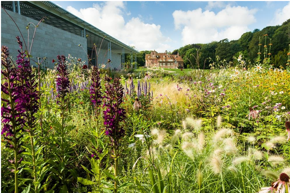
De tuinen van Piet Oudolf, bron: Museum Voorlinden