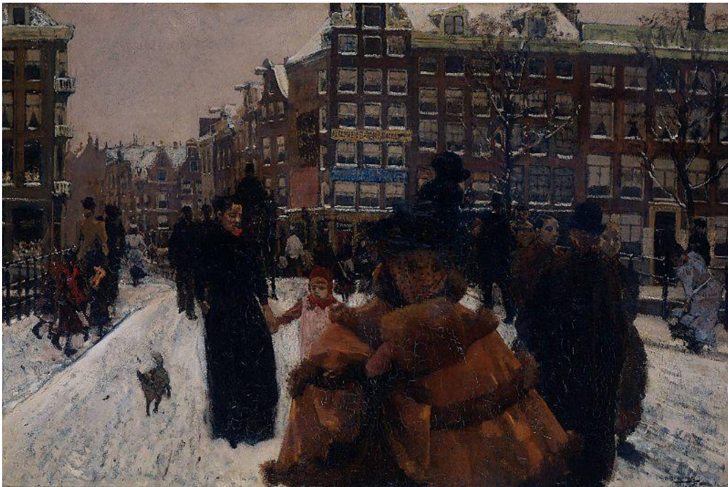
G. H. Breitner, De Singelbrug bij de Paleisstraat te Amsterdam (rond 1896), Rijksmuseum Amsterdam

Romanschrijvers en schilders brachten het niet altijd even florissante bestaan van de lagere klassen in beeld. Velen van hen sloten zich aan bij het socialisme en stelden hun kunst in dienst van de gelijkberechtiging.