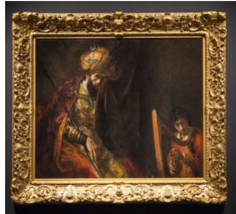
Rembrandt, Saul en David , Mauritshuis Den Haag