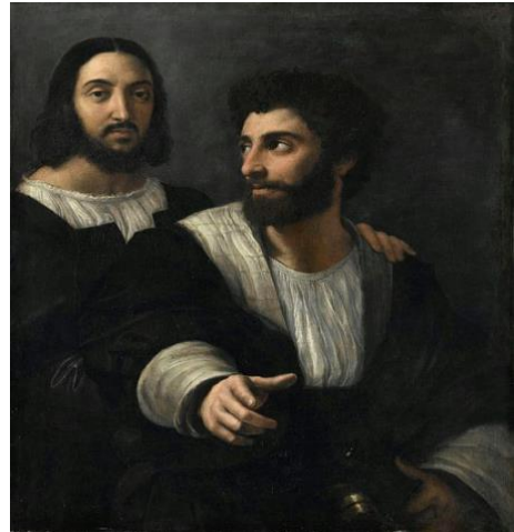
Rafaël, Zelfportret met een vriend , ook: Dubbelportret , 1518, Louvre Museum Parijs