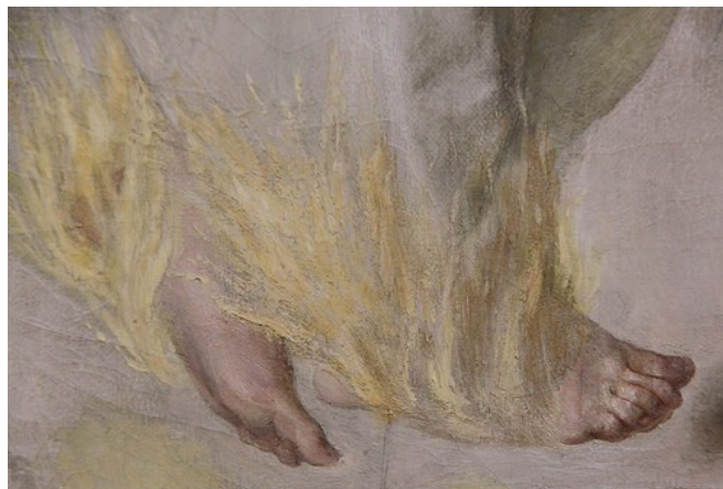
Voeten van aartsengel Gabriël op Rossetti's Ecce Ancilla Domini! (1849)