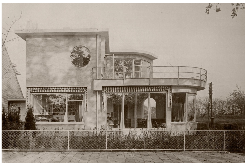
Van Ravesteynhuis in Utrecht, rond 1932