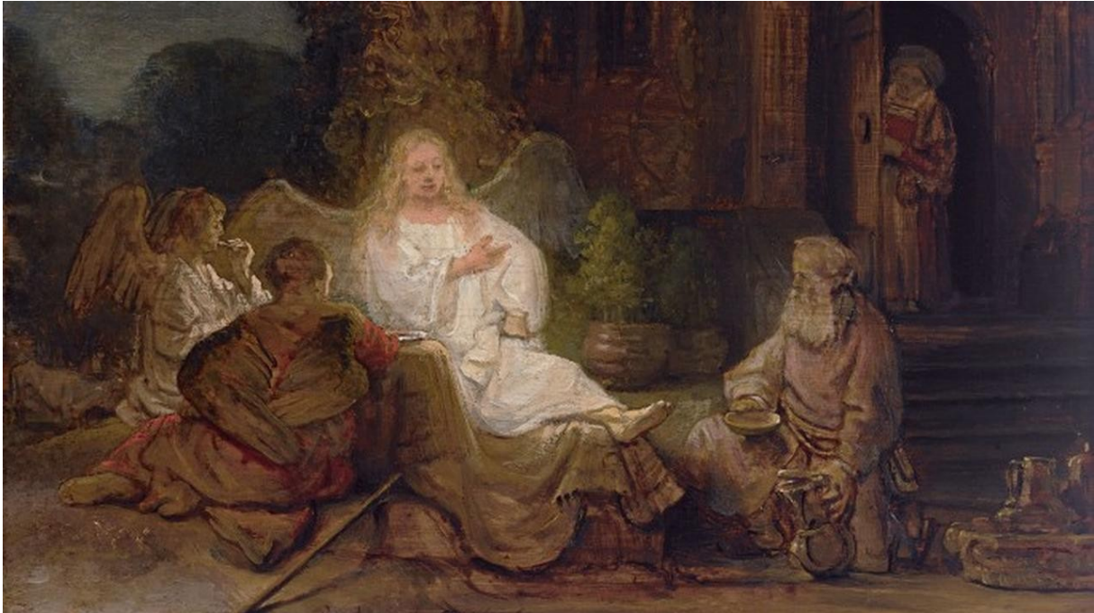
Rembrandt van Rijn: Abraham ontvangt de drie engelen (1646); paneel, 16 x 21 cm

In een televisieprogramma was afgelopen herfst kort een olieverfschets van Rembrandt te zien. Een anonieme eigenaar had deze aangeboden bij veilinghuis Sotheby's. Een zeldzaamheid, want naar schatting zijn er ter wereld nog hooguit twintig doeken van Rembrandt in privébezit. Het schilderijtje stelt het bezoek van de engelen aan Abraham voor, een verhaal uit het eerste Bijbelboek Genesis. De engelen komen het goede nieuws van de geboorte van Isaak brengen. Dat moet een onwaarschijnlijk bericht zijn geweest voor Abraham en zijn vrouw Sarah, want zij waren allebei al stokoud. De engelen zitten in een kringetje op de grond, één op de rug gezien; maar op de televisie glom het doek nogal, je kon het niet goed zien. Alexander Pechtold – voormalig veilingmeester – wees in de studio op het licht dat uit de middelste engel straalde: dit was het moment waarop God zelf zich openbaarde.