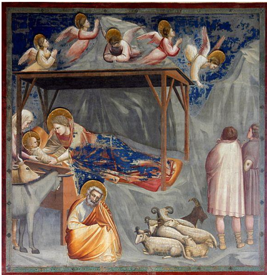
Giotto, De geboorte van Jezus, Scrovegni-kapel

Wie de kapel bezoekt wandelt onder een prachtig indigoblauwe sterrenhemel met goudgele sterren. De kapel is van boven tot onder voorzien van kleurige fresco's die bijbelverhalen verbeelden en afbeeldingen van de kardinale deugden en hun zondige tegenhangers. De kapel is ingedeeld in regelmatige ruimtes voorzien van diepteperspectief, waarin de handelende personages herkenbaar en levendig zijn afgebeeld.