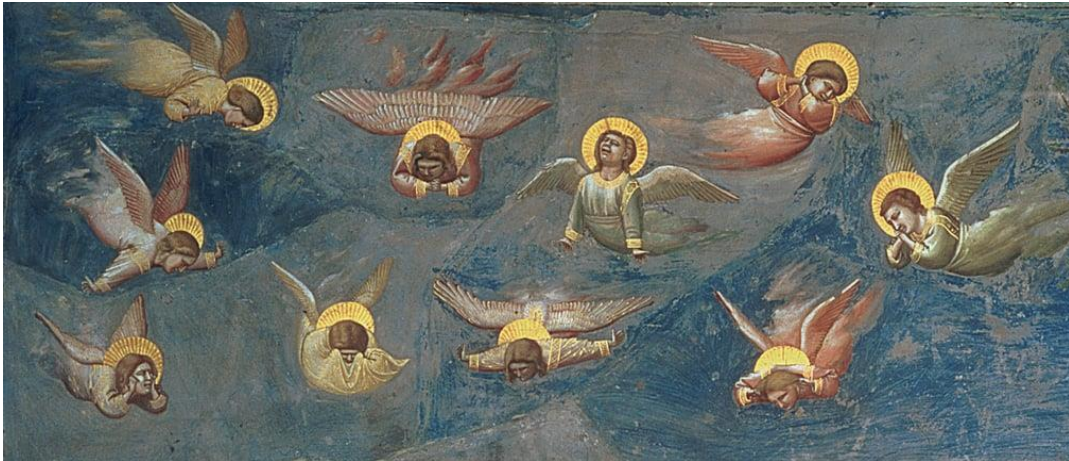
Giotto's engelen bij Christus' bewening, detail