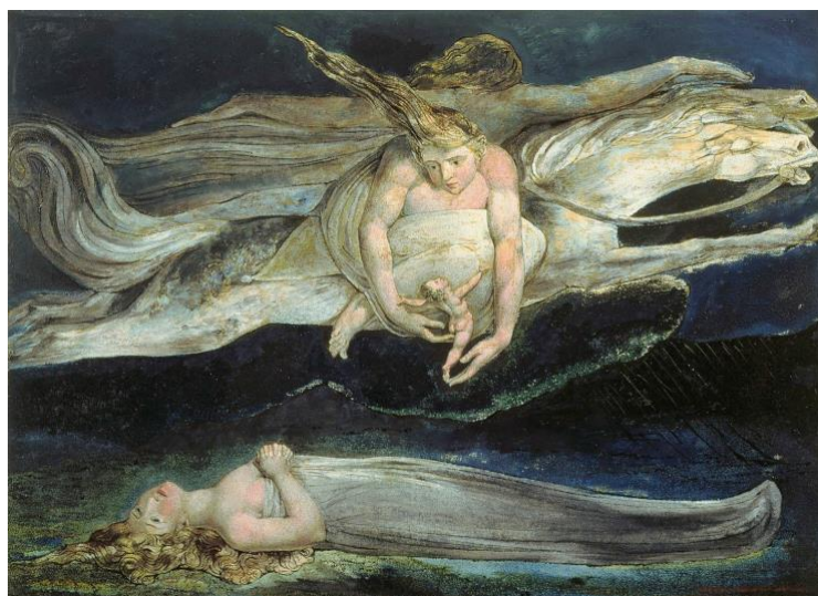
Pity (mededogen) door Willam Blake, 1795, Tate Gallery Londen

De Engelse dichter en schilder William Blake werd ooit door een biograaf een 'counter-culture prophet' genoemd en die karakterisering is maar al te raak. Dat geldt zowel voor het begrip 'tegencultuur' als voor de 'profeet'. Blake bouwde in zijn oeuvre een compleet eigen universum, dat losstaat van de cultuur waarin hij leefde, maar daar wel genadeloos commentaar op levert. Hij deed dat in de vorm van profetische teksten en visionaire beelden. Zijn kennis verkreeg hij door visioenen, die hij karakteriseerde als Verbeelding, 'the Imagination'.