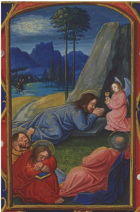
Tuin van Gethsemane met engel, collectie Huis van het boek, Den Haag

Aan het eind van dit eerste seizoen van 2022 vindt er een excursie plaats naar het (voorheen) Meermanno -Westreenianum Museum | Huis van het boek in Den Haag. Een kleine groep cursisten verkent het Helikon thema Engelen en vleugels krijgen in middeleeuwse handschriften. Uit de unieke collectie van het oudste boekenmuseum ter wereld is een keuze gemaakt rond het thema 'engelen in de kleurrijke miniaturen'. U kunt deze kostbare miniaturen op donderdagmiddag 7 juli van zeer dichtbij bewonderen.