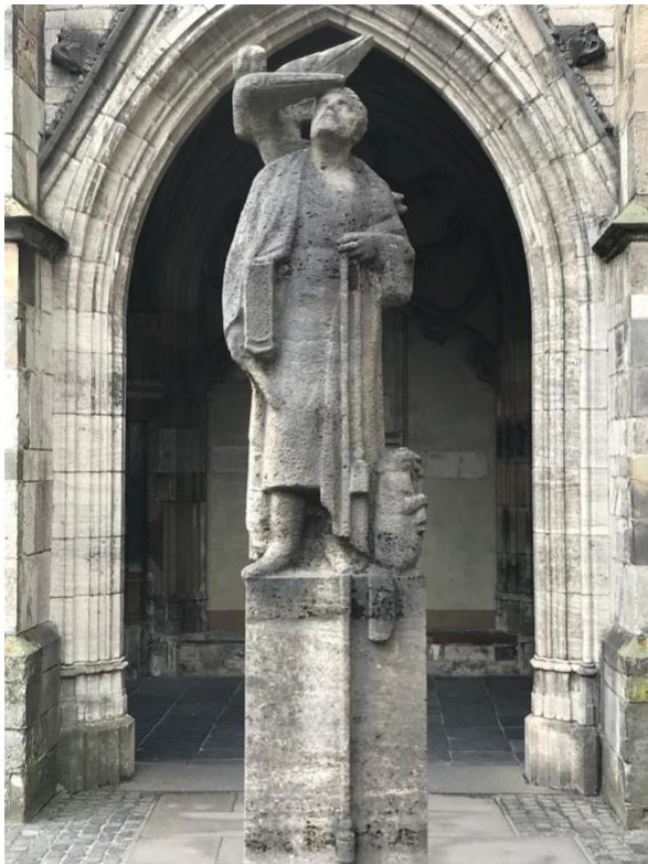
Jan van den Doem I door de beeldhouwer Paul Grégoire. Het beeld werd in 1970 in de Pandhof geplaatst.

Op weg naar Instituto Cervantes, naar de Helikonlezing over 'de melancholische engel van Dürer' - een prachtige lezing door de filosoof Ype de Boer op vrijdag 8 april - deed een vriend van mij eerst even de Pandhof aan, gelegen tussen Domkerk en Academiegebouw. Bekend met de rode draad van het lopende Helikonprogramma Vleugels krijgen! , maakte hij onderstaande foto en zond deze naar mijn mobiele telefoon met de tekst: Gearriveerd! Hier alvast een man met een engel. Waar staat deze figuur? vroeg ik hem. Hij staat minder dan honderd meter van Domplein 3 af, zo bleek. Hoe vaak was ik niet in de Pandhof en zag ik de schrijvende kanunnik in de fontein wel zitten, maar dit veel grotere beeldhouwwerk niet staan?