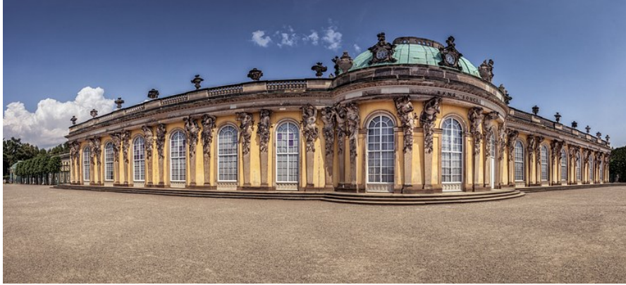
Schloss Sanssouci, Potsdam