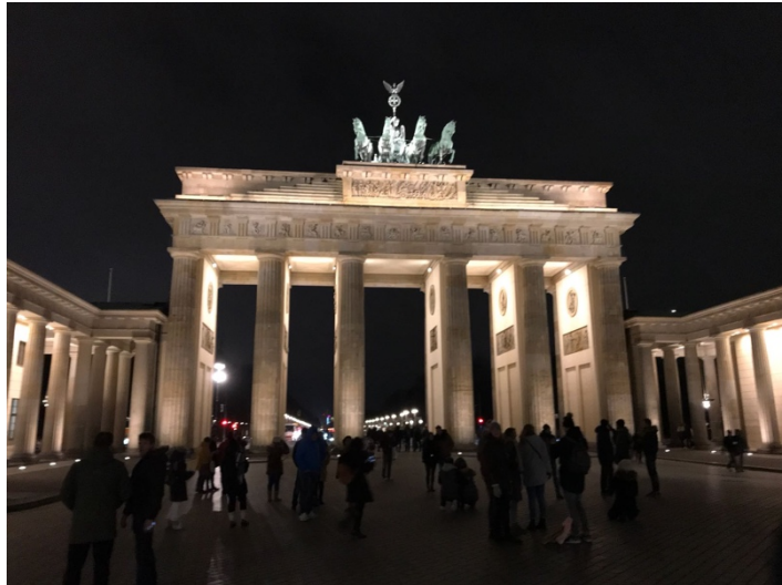
Brandenburger Tor

Vertrek met de trein vanaf Amsterdam CS om 11.00 uur en aankomst op het imposante Hauptbahnhof Berlin om 17.22 uur. Daarna reizen we naar het hotel in de wijk Charlottenburg, in het westen van de stad, enkele haltes van de Kurfürstendamm. Daarna gaan we de nabije omgeving voor het eerst kort verkennen. We wandelen een deel van de Ku-Damm en eten deze avond in een typisch Berlijns restaurant, in de buurt van het hotel.