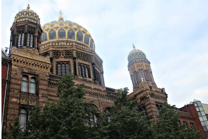
Die neue Synagoge, Oranienburgerstrasse

We eten in deze wijk en bezoeken 's avonds - aangenomen dat de reservering wordt gehonoreerd - de Reichstag met zijn boeiende koepel uit 1999.